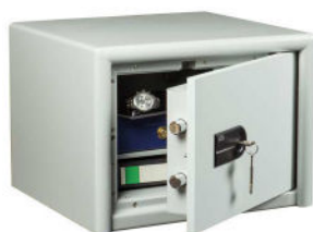
CL 20 S