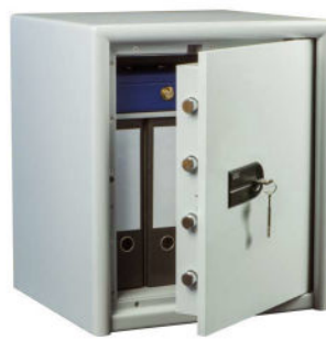
CL 40 S