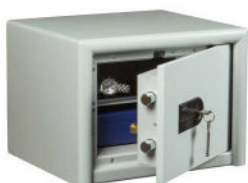
CL 10 S