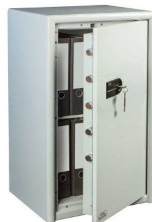
CL 60 S